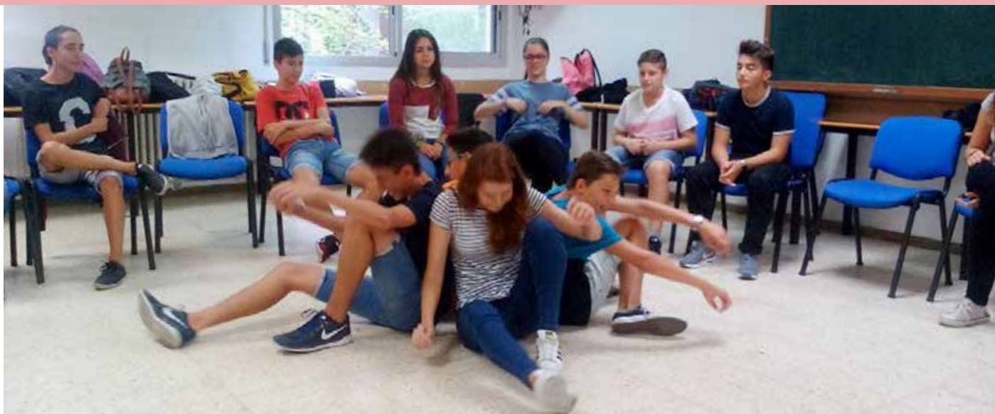
Actividad juvenil en Martí-Codolar.

(jóvenes de 19 años en adelante) reflexionaron sobre su dimensión vocacional y se preguntaron a qué se sentían llamados por Dios en ese momento; algunos de estos jóvenes hicieron más tarde un discernimiento para entrar en un grupo de aspirantes a Salesianos Cooperadores.