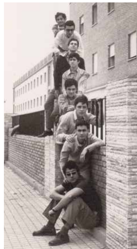
Residentes universitarios en el colegio. En el colegio se inició la universidad de Badajoz.

modidades mínimas. Hoy, después de 50 años, aquella semilla salesiana es una obra completa: colegio, parroquia, centro juvenil, plataformas sociales... Motivos suficientes para celebrar sus Bodas de Oro (1968-2018).