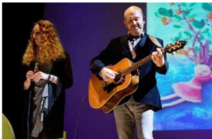
Dos momentos del evento vocacional 'Dreams, donde nadie sueña solo'.

de su decisión vocacional, los rostros de los chicos y chicas fuera de una sorpresa total al escuchar su testimonio. En un momento dado, "Sara" hizo la pregunta decisiva: "¿cómo pudiste ser feliz en esas circunstancias?"