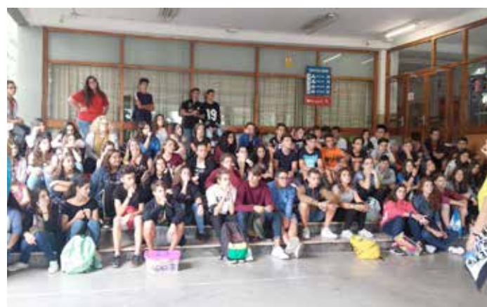
La comunidad salesiana junto a los jóvenes del Programa Buzzetti. // Momento de acogida a los jóvenes en Martí-Codolar.