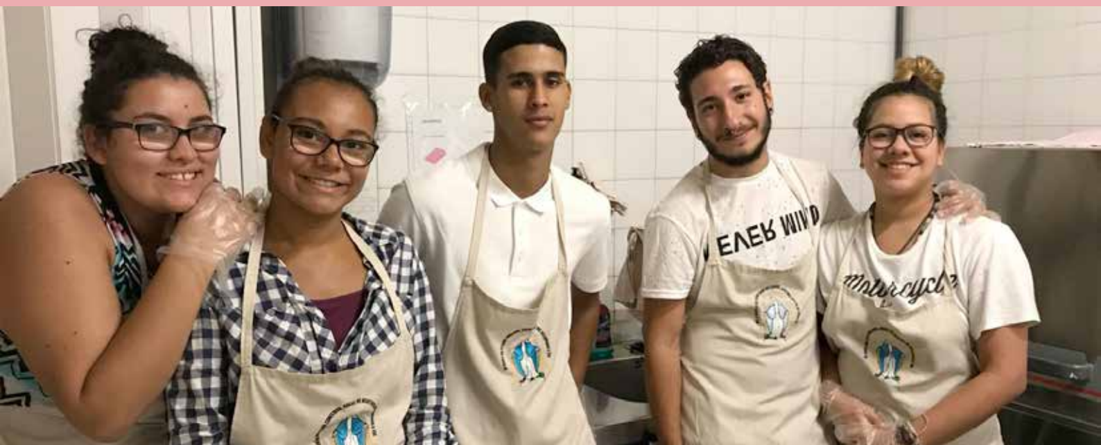
Chicos y chicas del Programa Buzzetti participando en una acción solidaria.

Acompañar a los adolescentes y jóvenes en la búsqueda de un sentido para la vida como vocación a la felicidad es una cuestión que la pastoral juvenil salesiana y, más en concreto, la campaña inspectorial “Ven y verás” han puesto en el centro de la atención.