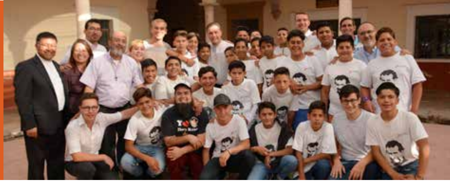
El Rector Mayor en un oratorio de frontera del norte de México.