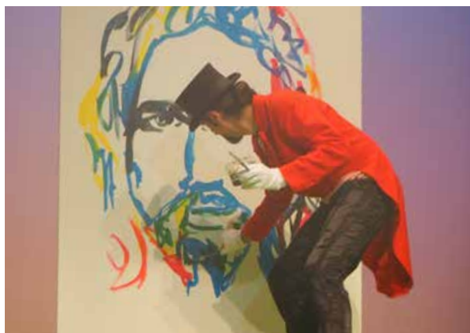
Gestos simbólicos en el Congreso Internacional.

ción como Familia Salesiana, al igual que incorporar la reflexión sobre la familia y la Pastoral Juvenil en todos los ambientes pastorales de las casas y los ambientes.