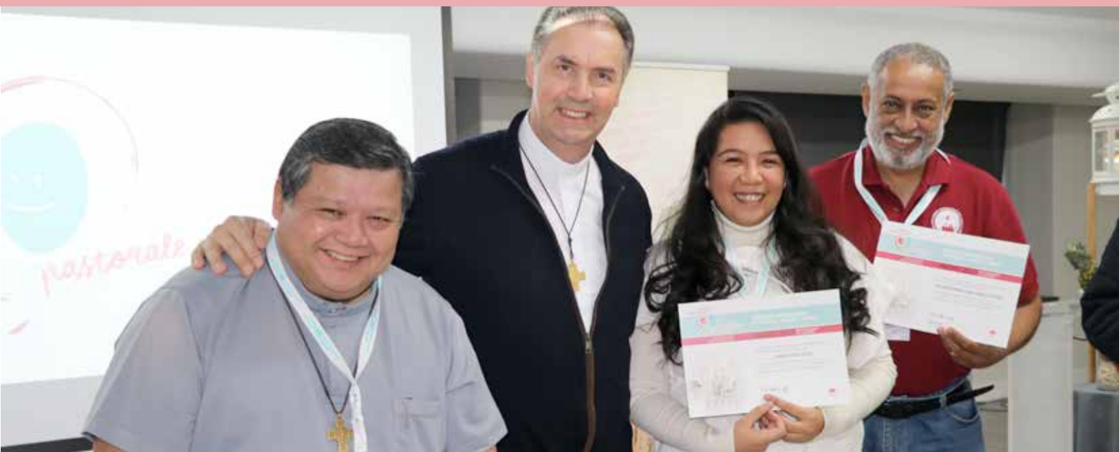
El Rector Mayor junto a participantes en el Congreso Internacional de Pastoral Juvenil y Familia.

El pasado mes de noviembre la Congregación Salesiana ponía en Madrid el epicentro de la relación entre Pastoral Juvenil y Familia. El Congreso Internacional SYM-Family17 , en el que participaron más de 300 laicos y religiosos de las Provincias salesianas de 132 países del mundo , fue el termómetro para medir este momento vital tras la celebración del Sínodo sobre la Familia y la publicación de la exhortación apostólica 'Amoris Laetitia' , y justo a las puertas del Sínodo sobre los Jóvenes , que se desarrollará del 3 al 18 de octubre de 2018.