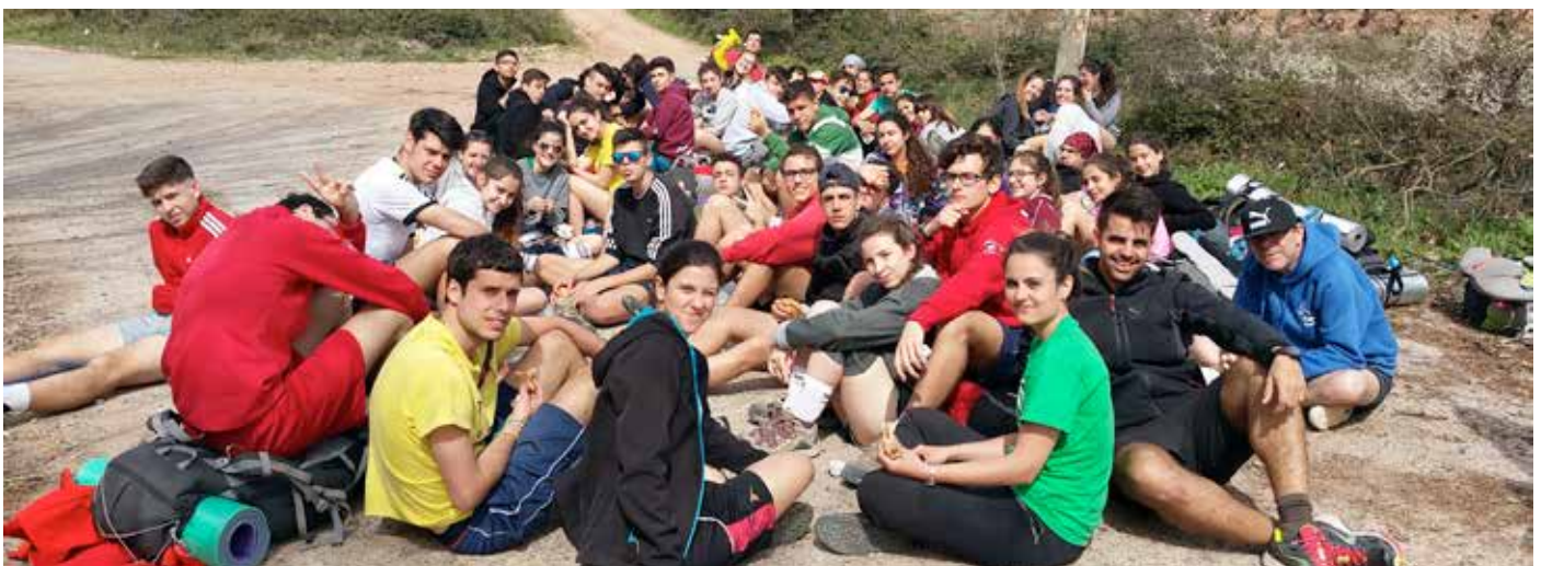
Pascua Peregrina de los jóvenes de Salesianos Zaragoza.