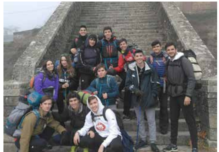
Llegada triunfal a Santiago de Compostela para el grupo de Alicante // El grupo de Salesianos Mérida en un alto en el Camino.